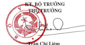
Trần Chí Liêm

QĐ số 5471/QĐ-BYT, ngày 27/12/2006 của Bộ Y tế phê duyệt KHHĐ Nuôi dưỡng trẻ nhỏ